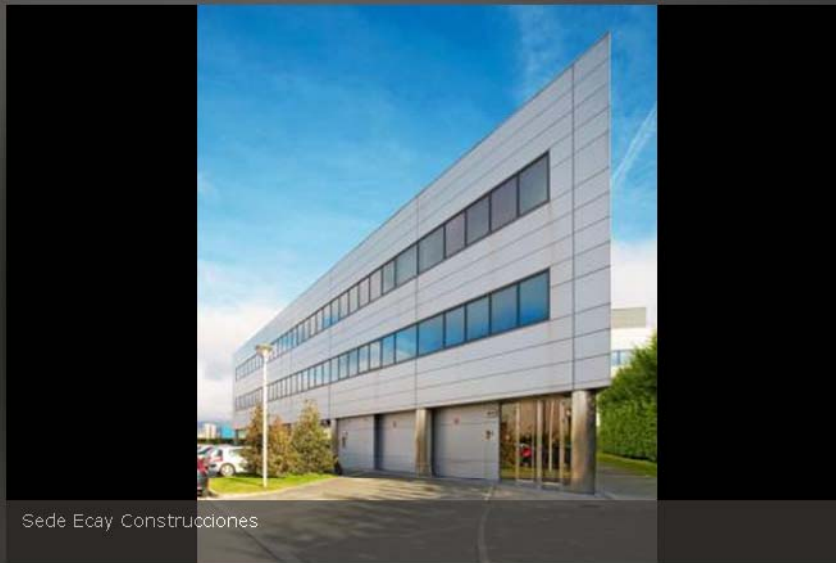
Sede Ecay Construcciones