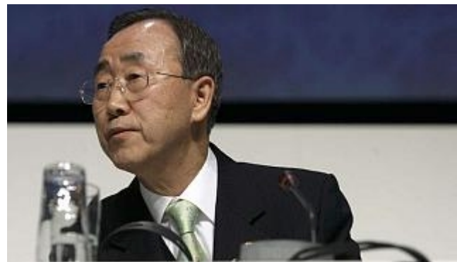
El secretario general de Naciones Unidas, Ban Ki-Moon.

Las diez empresas más admiradas del mundo y muchas de las más importantes de España desarrollan prácticas de Responsabilidad Social Corporativa y las difunden para rentabilizarlas. Mientras, Naciones Unidas les exige información más rigurosa sobre los avances en este campo